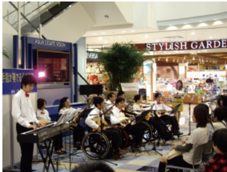
大垣市アクアウォークにて